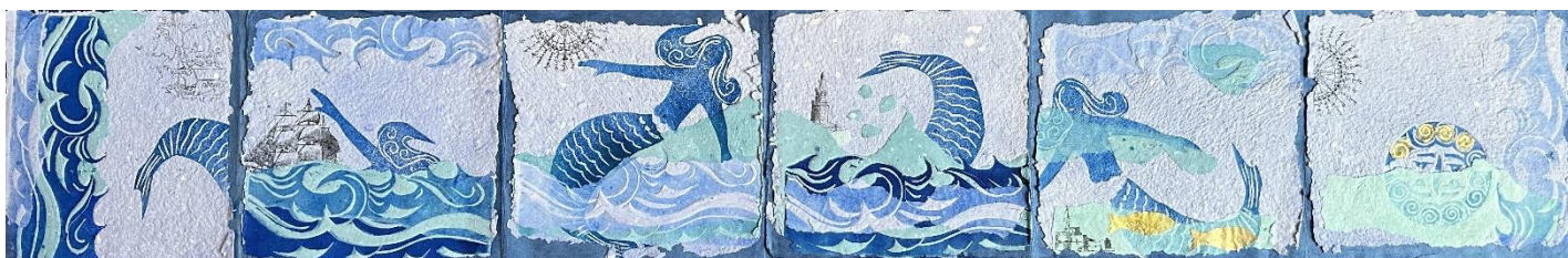
Voyage de sirène © Frédérique Le Lous Delpech

Une aventure pour petits et grands, où chaque page vous transporte dans les profondeurs mystérieuses des océans.