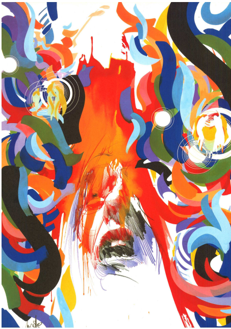
Raymond Moretti « Je n'oublie rien » lithographie couleurs in « œuvre poétique » de Jacques Brel, édité par Israël, 1986