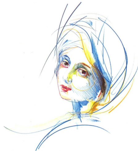
Raymond Moretti : « Chroniques Italiennes », [Beatrix]. Crayons, gouache, 1986