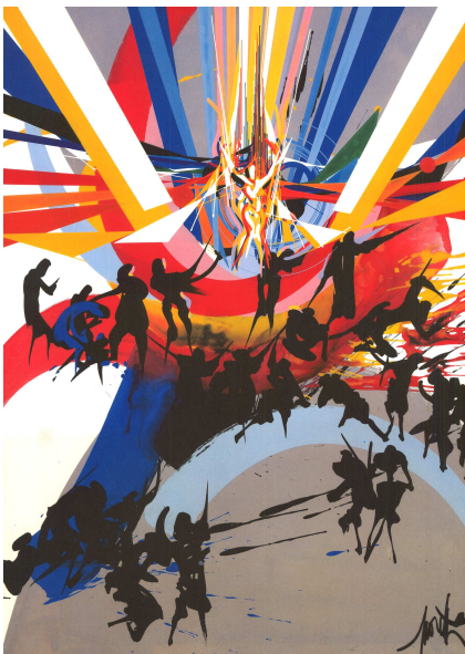
Raymond : « L'homme dans la cité » lithographie couleurs in « œuvre poétique » de Jacques Brel, édité par Israël, 1986