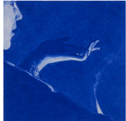
André Marzuk Recueil de silences Pastel sec sur papier Fabriano - 46 x 56,5 cm 1992