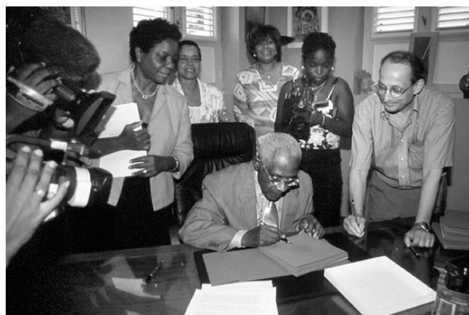
Aimé Césaire et André Marzuk - Signature du livre d'artiste « Cœur ignition » 2002 - Mairie de Fort-de-France

Point de vue sur l'Art d'André Marzuk : « Je suis rebelle à tous les dogmes, y compris ceux d'une esthétique contemporaine officielle qui imposent une inscription dans le politique comme un nouvel académisme. Mon travail s'inscrit dans une conception poétique d'un art en recherche de vérité. D'accord en cela avec le propos de Man Ray quand il dit : « Il n'y a pas plus subversif que la vérité » ou avec Giacometti disant: « L'art m'intéresse beaucoup, mais la vérité m'intéresse infiniment plus... »