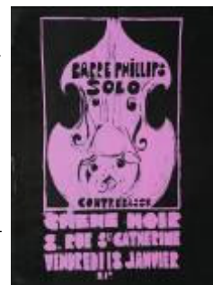
Barre Phillips au théâtre du chêne noir, 1974

(La carrière de Barre Phillips, soit une centaine d'albums, ne se résume pas à ceux énumérés ci-dessus.)